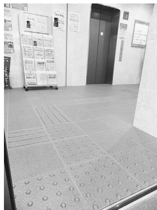
1F 入り口からの点字ブロック